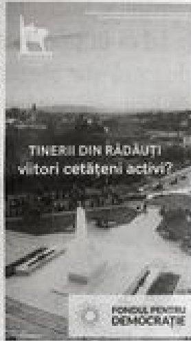
În care aceste persoane își desfășoară activitatea. Dacă

Evenimentele sunt facilitate de Luca Ciobotaru, doctorand în drept constituțional, pre-